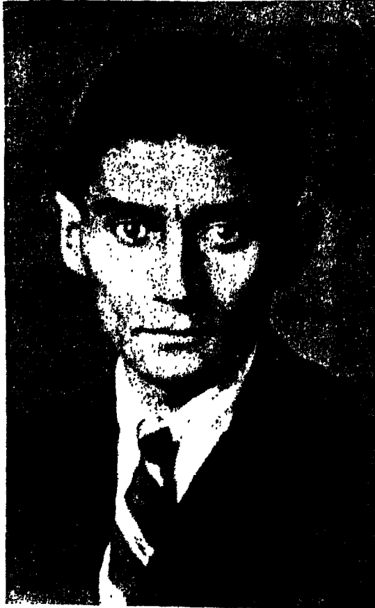
فرانز كافكا آخر صورة (برلين، عام ١٩٢٤)